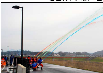
倉吉市消防団による放水