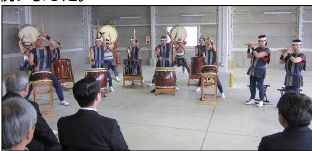
倉吉打吹太鼓の皆さんによる演奏

当日は生憎の空模様でしたが、約100名の関係者が出席し、地域の安心・安全を守る施設の完成を祝いました。