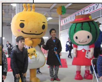
ミササラドン、夏味ちゃんも出没