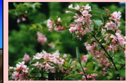
天神川の花 タニウツギ