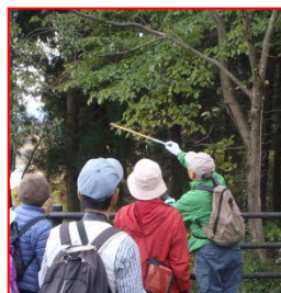
大山池・木の実の里