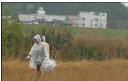
昨年度（4月17日）の様子