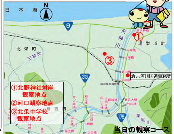
① 北野神社対岸観察地点

普段は気にせず眺めていた光景ですが、専門家の解説や主眼を持った観察をすると、自然の大切さや関わり方など考えるところが沢山ありました。この観察会に参加して頂いた方々も何か新しい発見や認識を持たたのではないかと考えています。