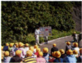
水質調査の方法を聞き、実際にやってみる子ども達