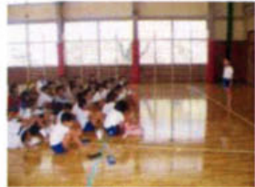
メール友達と初めての対面!

その途中で南小学校を訪れました。訪れたのは上北条小学校 4 年生、迎えてくれたのは南小学校の 3・4 年生達でした。