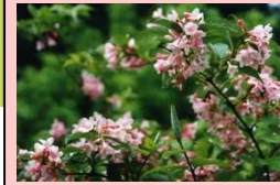
天神川の花 タニウツギ

【内 容】砂防ダム工事現場見学会では、天神川上流域(穴鴨地区・木地山地区)において土砂災害の防止・軽減のための砂防施設の工事現場を直に見学いただき、身近に体験していただくことで防災意識の高揚を図ることを目的としています。