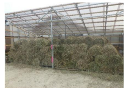
(堤防刈草の無償配布)