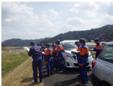
(水防団との合同現地確認)