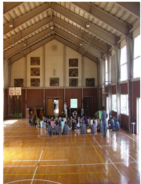
三朝町説明会実施状況(H18.6.19)