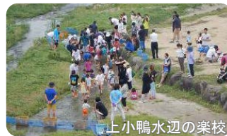
上小鴨水辺の楽校