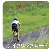
サイクリングロード