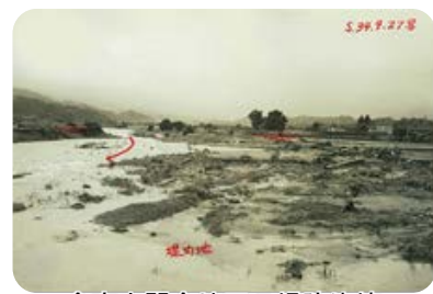
倉吉市関金地区の堤防決壊 (S34 年伊勢湾台風洪水)