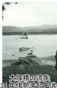
大塚橋の流失 (S34 年伊勢湾台風洪水)

昭和 34 年伊勢湾台風洪水は、天神川においては戦後最大の洪水であり、家屋の浸水被害や内水被害が発生しました。