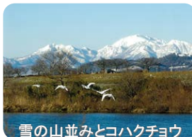
雪の山並みとコハクチョウ