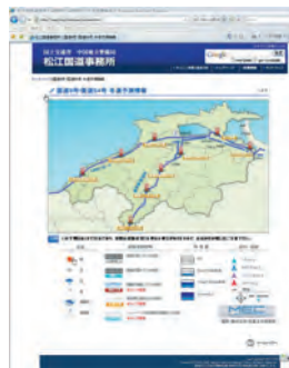
島根県東部の国道9号5箇所、国道54号4箇所の情報を見ることができます。

島根県東部地域の国道9号・54号について、路面状況や天気などの予測情報を見ることができます。予測情報は3時間ごとに更新され、24時間後までの情報を見ることができますので、お出かけ前に通過予定時間の情報を知ることができます。