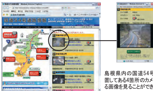
島根県内の国道54号に設置してある4箇所のカメラによる画像を見ることができます。