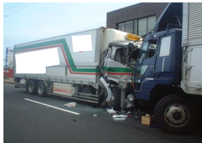
大型車同士の衝突事故 (H16.6発生 出雲市大島町地内)