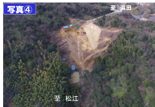
湖陵IC (仮称) 改良