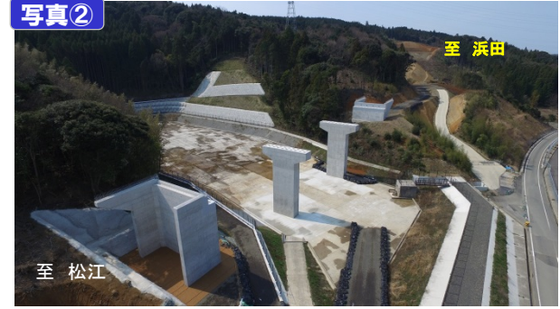
出雲IC付近 東神西第一高架橋