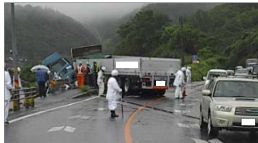
トレーラーによる単独事故 (H21.7発生 出雲市多伎町口田儀)