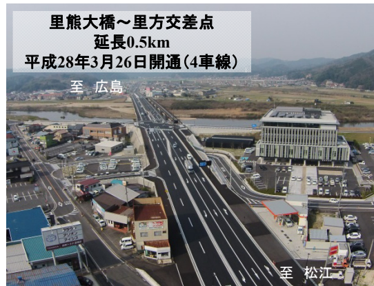
里熊大橋 広島方面を望む