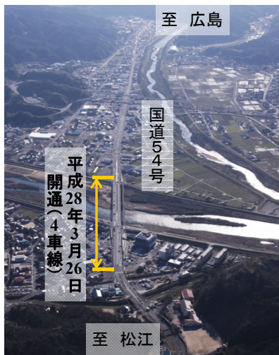
上空より里熊大橋周辺を望む