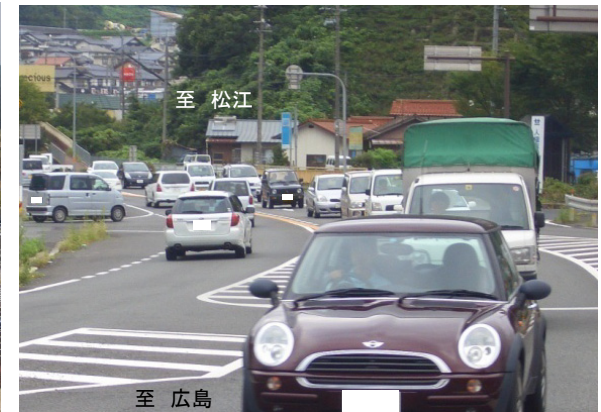
里方交差点付近 夕方ピーク時の状況