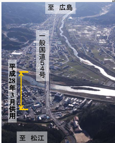
上空より里熊大橋周辺を望む