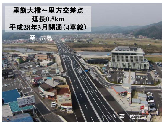
里熊大橋 広島方面を望む