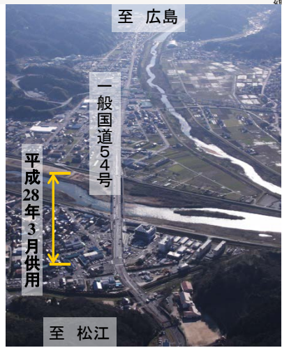
上空より里熊大橋周辺を望む