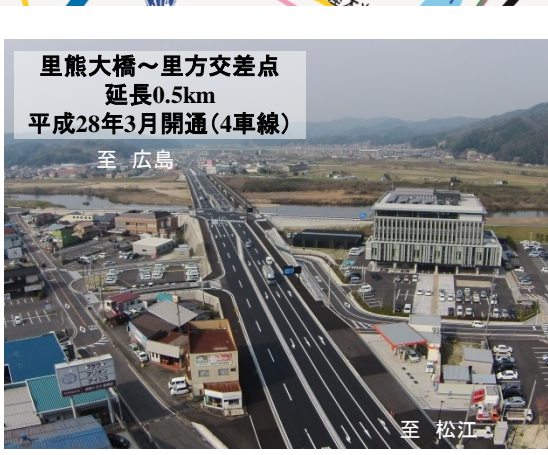
里熊大橋 広島方面を望む