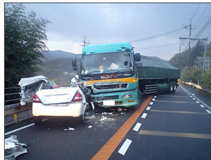
トレーラーと普通車の正面衝突事故 (H21.12発生 大田市朝山町)