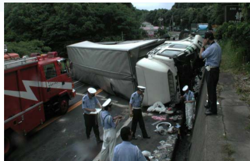
大型車の事故で約2時間全面通行止め (H16.6発生 大田市静間町)