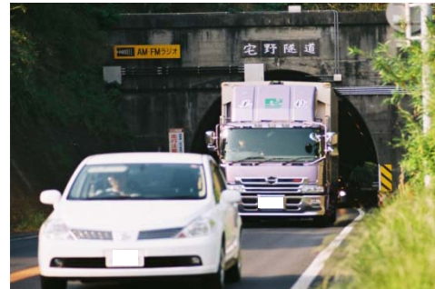
建築限界が不足するトンネル (H19.5 宅野トンネル)