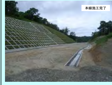
12. 馬路地区改良工事