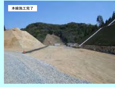
11. 天河内地区改良工事