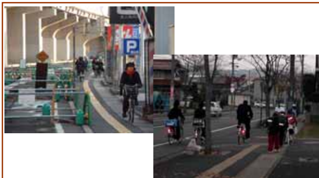
（歩行者と自転車の輻輳）