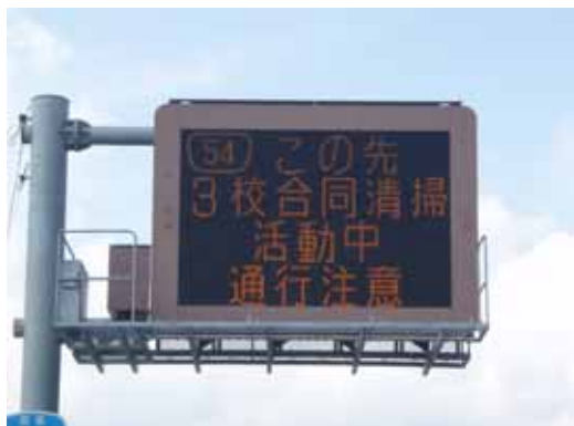
道路情報板による道路利用者への注意喚起

前回の清掃活動の様子です。毎年実施していただき、国道54号の美化に協力いただいています。