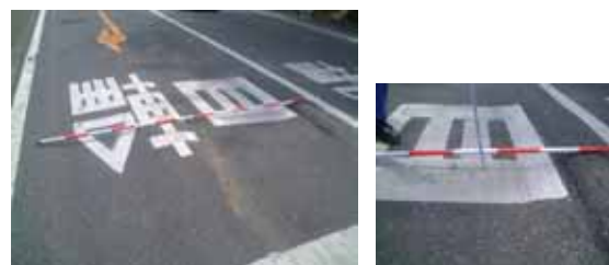
舗装のわだち掘れ