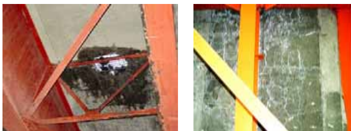
橋の裏面の様子(床版)

道路が傷められる原因のひとつとして、無許可や通行条件違反で通行することがあげられます。このルール違反の車両が、非常に大きな比率を占めている状況にあり、道路や橋に与える影響は多大です。特に、重量超過の車両が道路に与える影響は、非常に大きなものがあります。