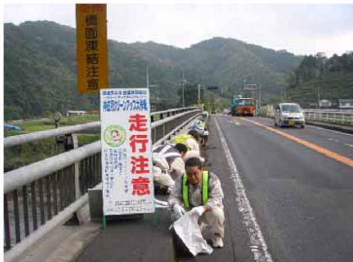
雲南市三刀屋町乙加宮地内