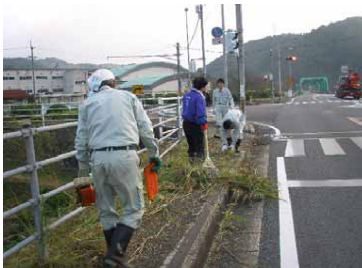
雲南市立三刀屋中学校付近