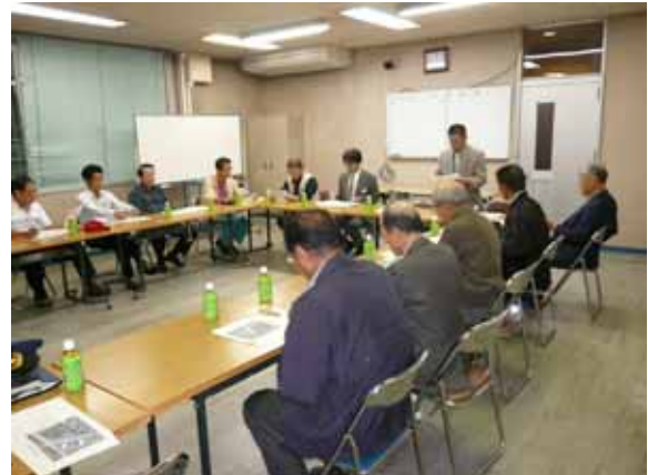
10 月 説明会の様子