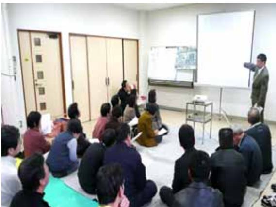
1 月 検討会の様子