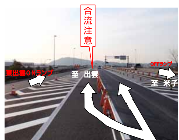
西向き(出雲市方面)を望む