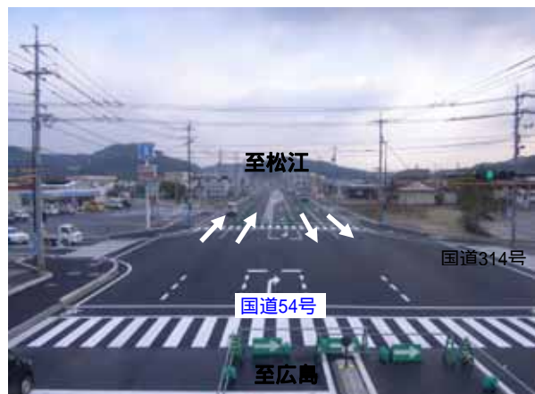
北向き(松江方面)を望む