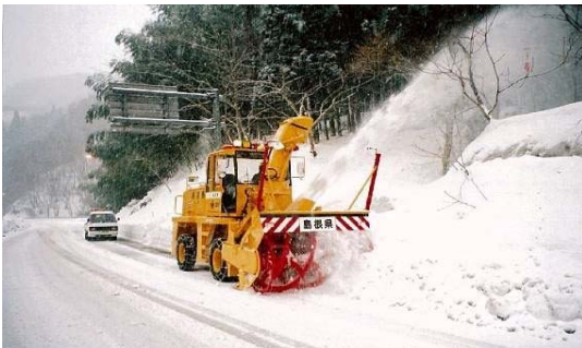
ロータリー除雪車