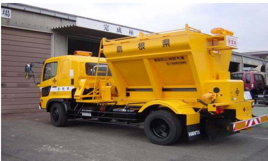
凍結防止剤散布車