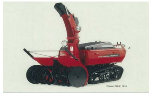
ハンド式ロータリー除雪車