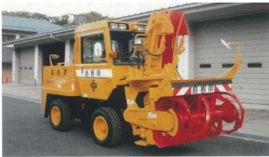
小型ロータリー除雪車