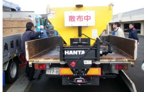
凍結防止剤散布機（車載式）