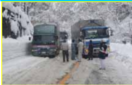
雪道でのスリップ事故と立ち往生の状況