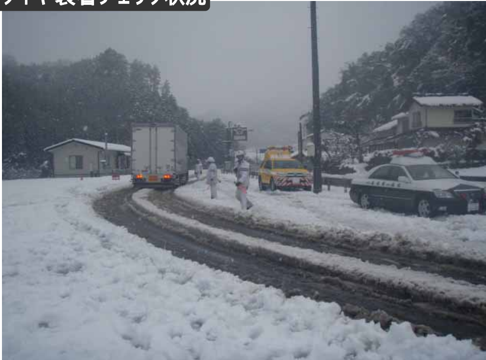
昨年（平成22年3月）の雲南警察署と国土交通省による合同での冬用タイヤ装着チェックの状況