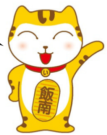
飯南町 マスコットキャラクター い〜にゃん