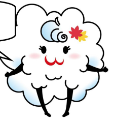
三次 観光イメージキャラクター ぎりこちゃん