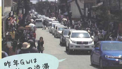
昨年GWは 最高16kmの渋滞