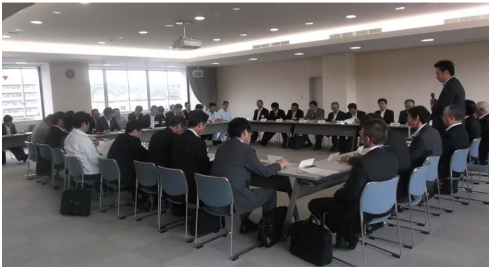
第2回島根県道路メンテナンス会議の開催状況

このような課題に対応するため、島根県内の道路施設の維持管理・補修・更新等を計画的・効率的に行うことを目的に、高速道路、国道、県道、市町村道の道路管理者からなる「島根県道路メンテナンス会議」を平成26年5月27日に設立し、島根県内のトンネル、道路橋等の施設の予防保全・老朽化対策の強化を図ることとしました。