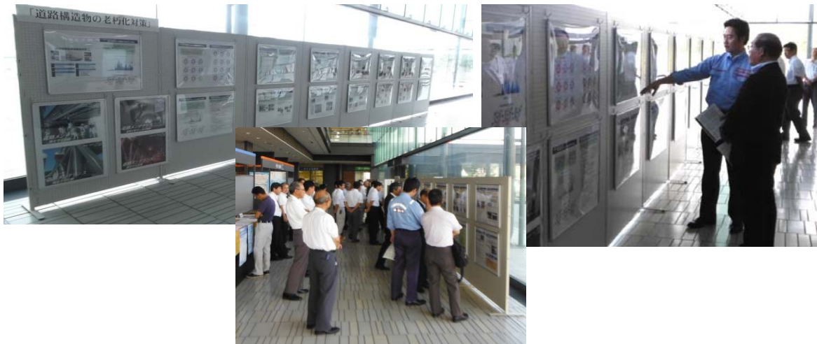
パネル展の開催状況(出雲市役所)