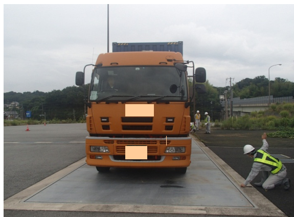
車両重量計測状況