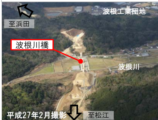
波根川橋(延長約300m) 施工状況