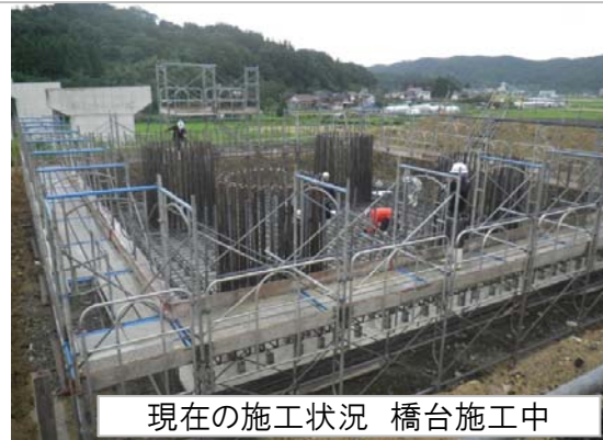
現在の施工状況 橋台施工中