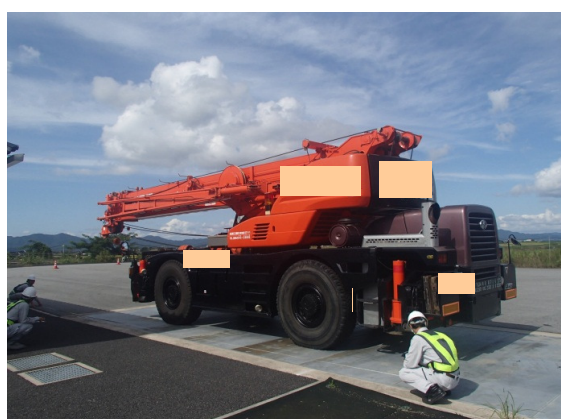
車両寸法計測状況