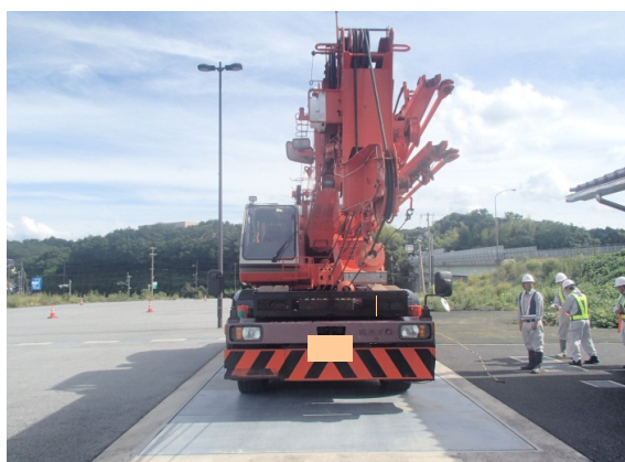
車両重量計測状況