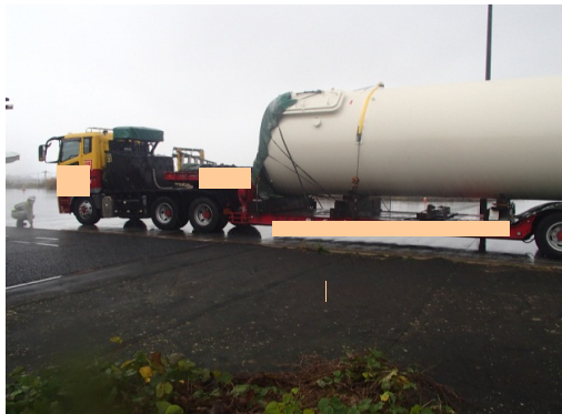
車両重量計測状況