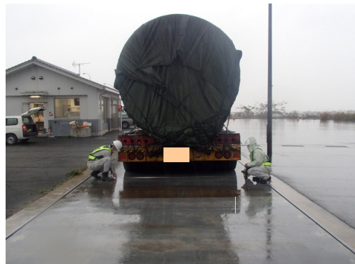
車両寸法計測状況