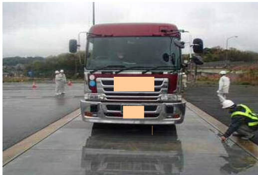
車両重量計測状況