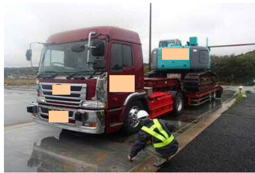
車両寸法計測状況