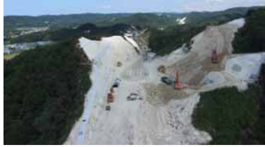
工事現場の状況(終点より)