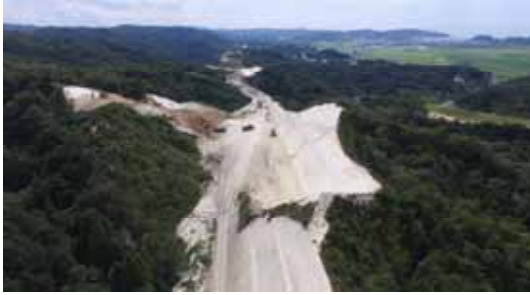
工事現場の状況(起点より)