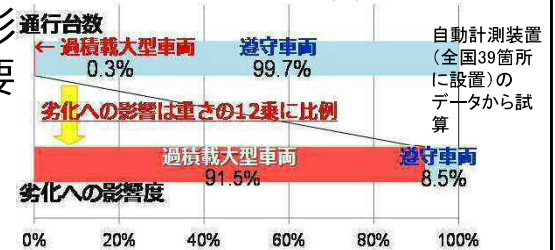
【図 道路橋の劣化に与える影響】

基準の2倍以上の重量超過の悪質違反者に厳罰化⇒現地取締りで違反を確認した場合は告発(レッドカード)