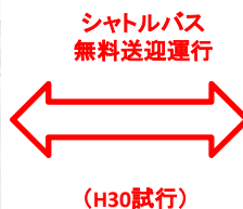
出雲市役所大社支所