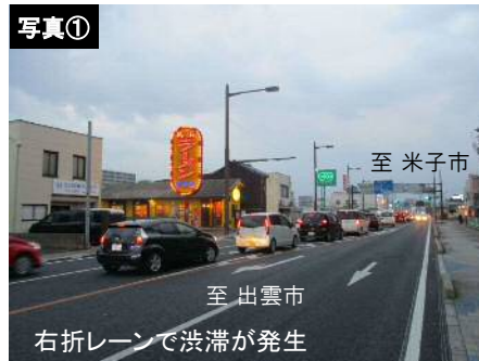
〈国道9号 上り線 西津田交差点以西〉