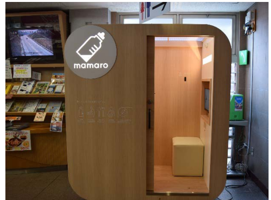
道の駅「赤来高原」での授乳室設置状況