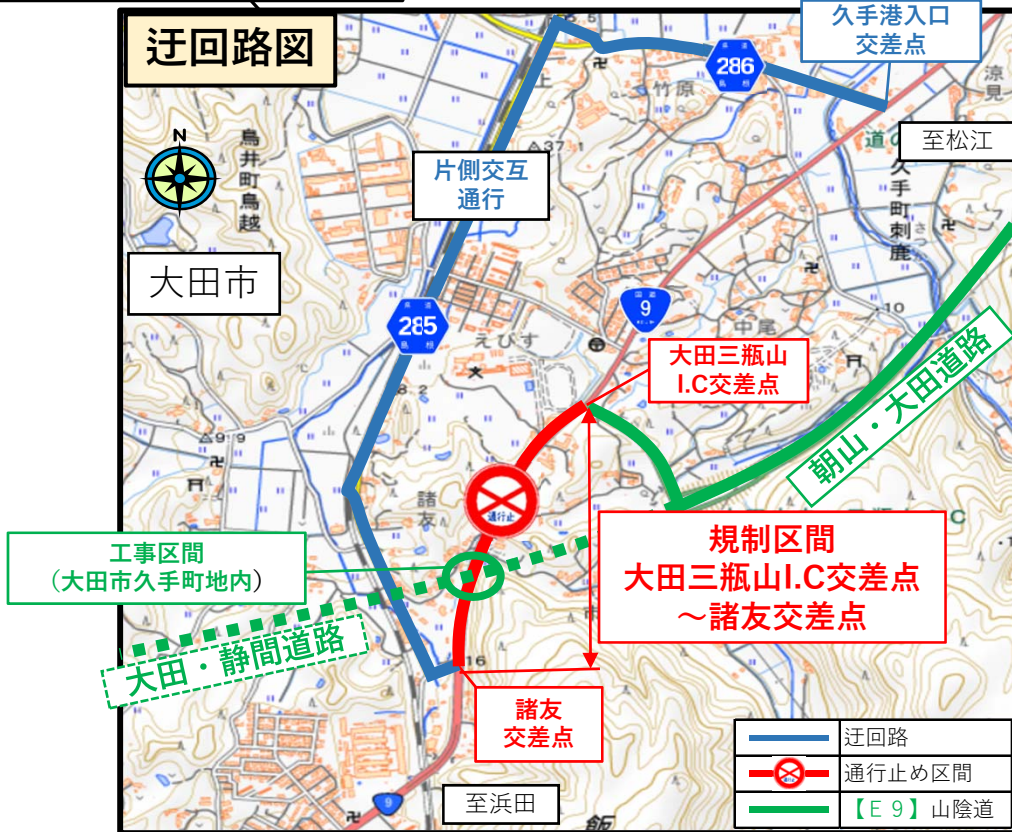
交通規制の予定表