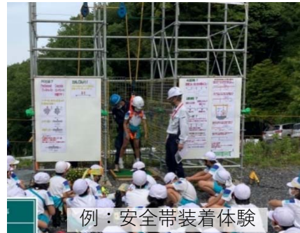
例：安全帯装着体験