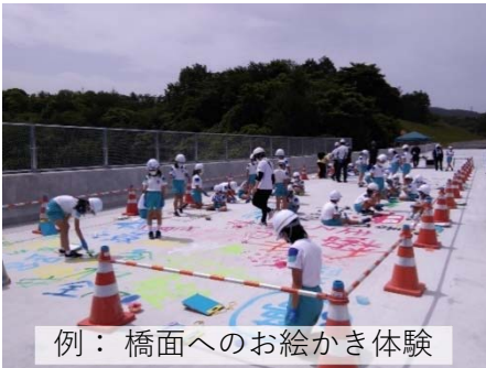
例：橋面へのお絵かき体験