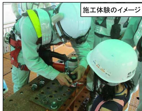
施工体験のイメージ