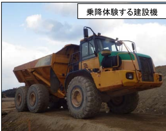
乗降体験する建設機