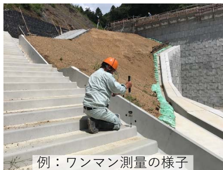
例：ワンマン測量の様子