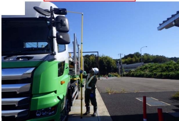
車両高さ計測状況