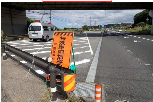
車両引込箇所状況