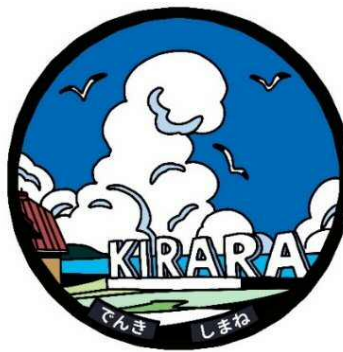
1 道の駅 キララ多伎 2 仁摩サンドミュージアム 3 道の駅 サンピコごうつ