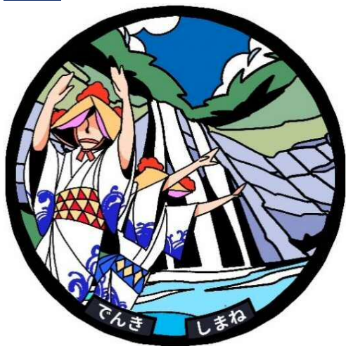
1 道の駅 掛合の里