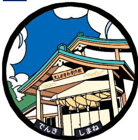
2 道の駅 頓原