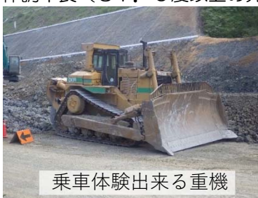
乗車体験出来る重機