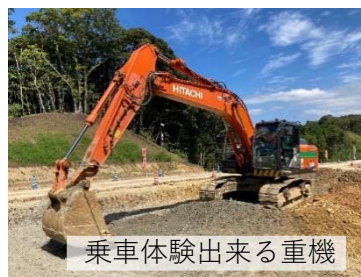
乗車体験出来る重機