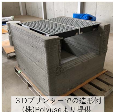
3Dプリンターでの造形例