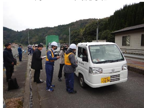
ドライバーへの呼びかけ活動