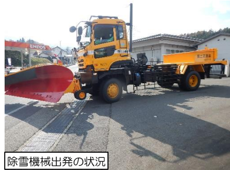
除雪機械出発の状況