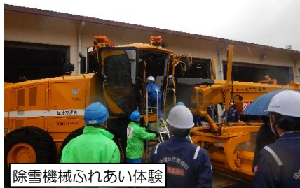
除雪機械ふれあい体験