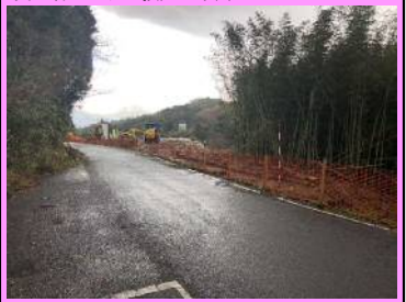
5. 二部地区改良第10工事 概要：道路改良 受注者：カナツ技建工業株