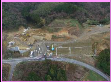
3. 二部地区改良第11工事 概要：道路改良 受注者：まるなか建設株